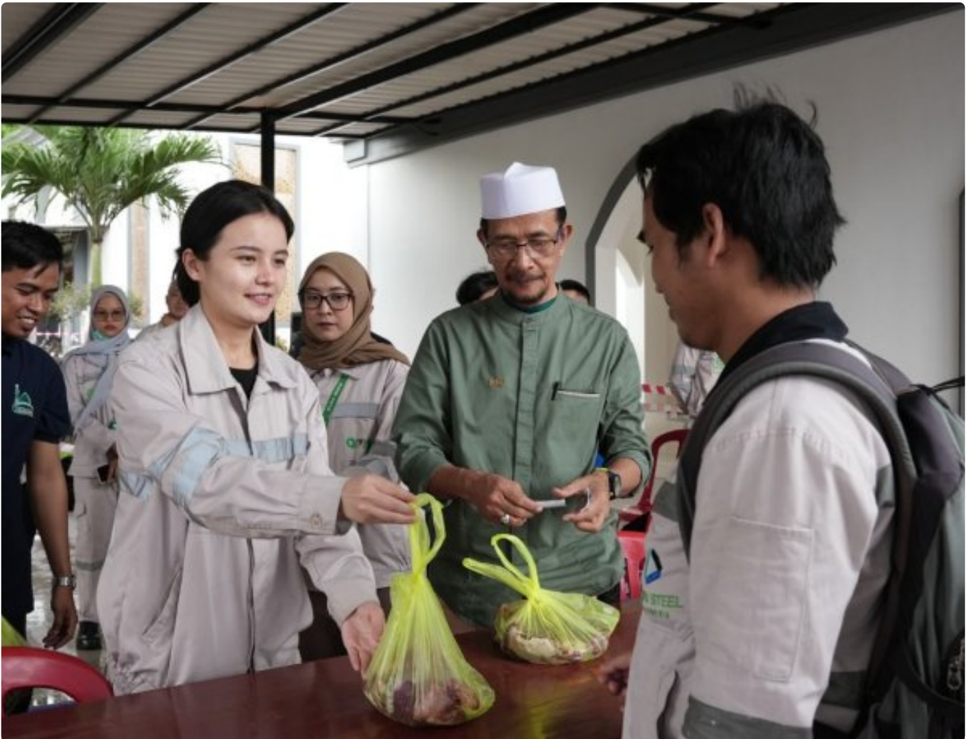
Karyawan non muslim di PT IMIP panitia kurban