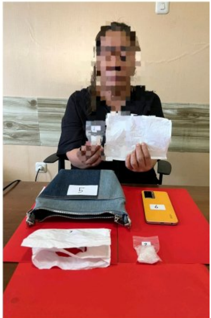
Tampak 2 wanita di tangkap Satreskoba Polres Morowali

MOROWALI, Sulawesi Tengah- Satuan Reserse Narkoba Polres Morowali Polda Sulteng, berhasil mengungkap kasus penyalahgunaan narkotika jenis sabu di Desa Topogaro, Kecamatan Bungku Barat, Kabupaten Morowali Propinsi